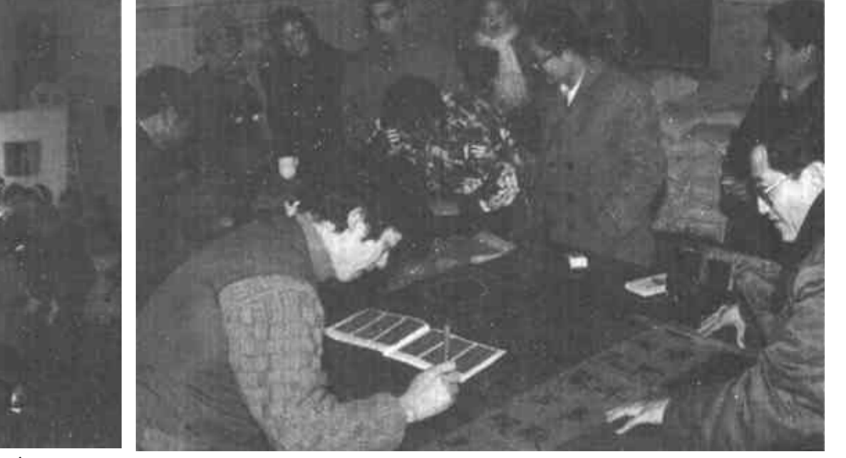
著名教育家李叔同，是我国近代美术、音乐教育的发轫者之一。做为一代教育宗师，他身体力行的“温而厉”教育法是留给后人的一笔宝贵财富。 所谓“温而厉”教育法，是说他对学生的教育方法是温和友善而又严肃认真的。他学贯中西，功底深厚，但丝毫没有“名士”的倨傲之气。他非常尊重学生，课前课后，都认真地向学生鞠躬致敬；从不当众斥责学生，批评学生很注意场合与分寸。他注意仪容仪表，衣着整洁朴素，举止端庄，谈吐文雅，一派温文尔雅的学者风度。同时，他对学生的要求又是极端认真和严厉的，对学生学业和品行上哪怕微小的疏忽和过失，他都要以适当方式给予认真的劝戒和忠告，决不姑息迁就。“温而厉”教育法，体现了李叔同先生深厚的文化修养、博大的仁爱之心和极端负责的敬业精神。“温”和“厉”这一对矛盾，和谐统一于李叔同先生堪为人师的言谈举止之中，在学生中产生了巨大的感召力，因此，在他的学生中，出现了像丰子恺、潘天寿、刘质平这样一批国内外知名的艺术家，就不是偶然的现象了。著名教育家夏丏尊对李叔同有如下评论：“他做教师，有人格做背景，好比佛菩萨的有‘后光’。他是实行人格感化的大教育家。”