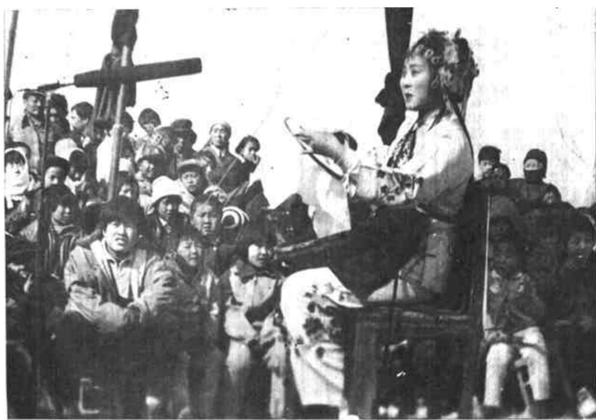
垦利县吕剧团常年坚持送戏下乡，把精神食粮送到农村。去年他们已下乡演出150多场次。