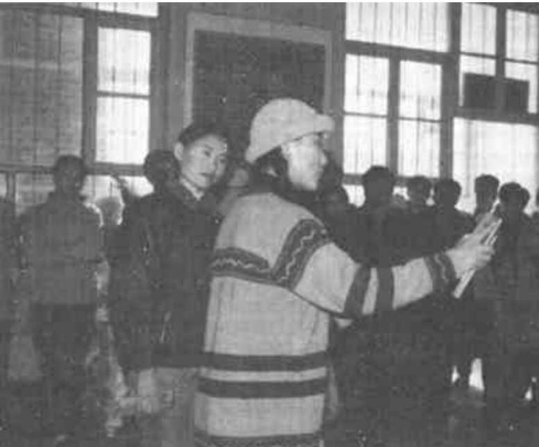
元旦、春节期间，河口区文化艺术中心开展了丰富多彩的文化下乡活动。 左图：文艺工作者正为乡亲们表演快板。 右图：文化馆的工作人员正在为村民书写春联。